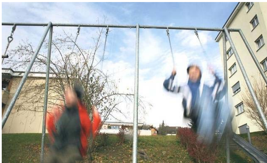
Kinder und Jugendliche mit Aufmerksamkeitsdefizit-Syndrom – oft «Zappellphilippe» genannt – werden mit Ritalin und verwandten Produkten behandelt.

Der Absatz von Ritalin-Präparaten hat sich in einem Jahrzehnt verachtfacht. Nun wollen Politiker wissen, warum.